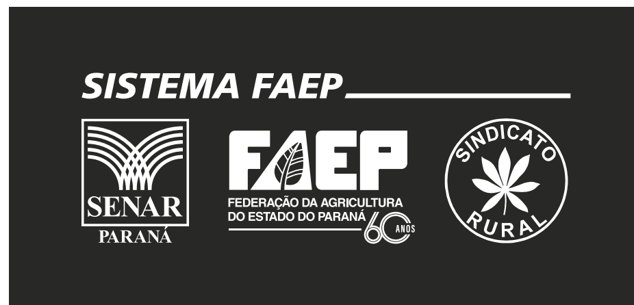
Versão monocromática - Branco