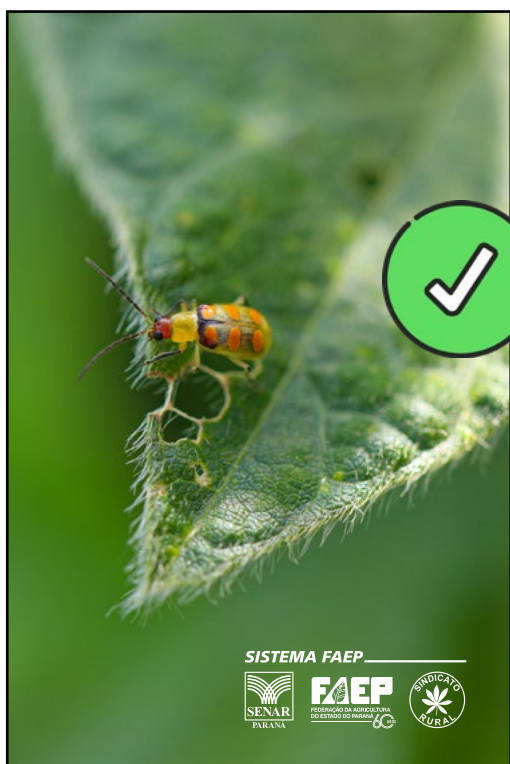
Imagem com área de fundo escuro disponível