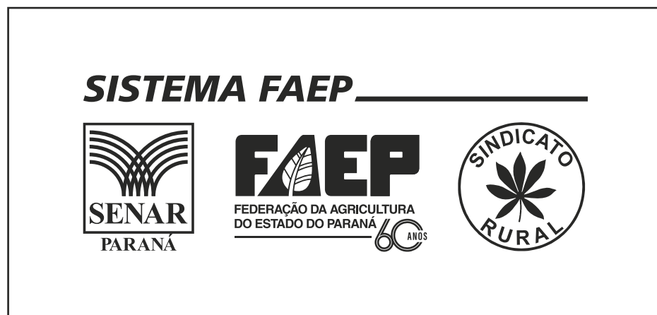
Versão monocromática - Preto

Em caso de limitações quanto ao número de cores disponíveis em um determinado processo de impressão ou gravação, podem ser empregadas as versões monocromáticas da marca.