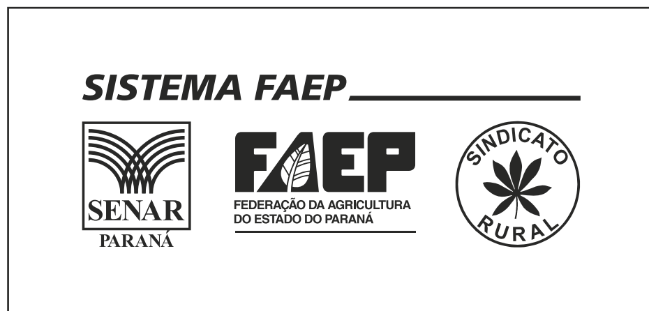
Versão monocromática - Preto

Em caso de limitações quanto ao número de cores disponíveis em um determinado processo de impressão ou gravação, podem ser empregadas as versões monocromáticas da marca.