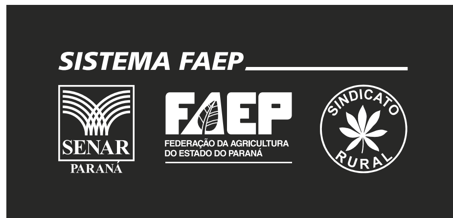
Versão monocromática - Branco